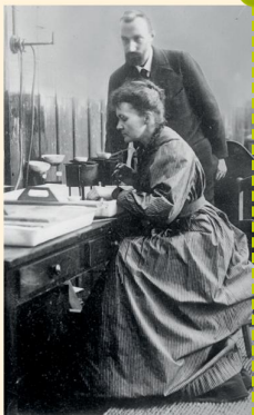
Pierre et Marie Curie dans leur premier laboratoire (1896-1905).

► Placer ces événements sur une frise chronologique dont les graduations et l'origine seront judicieusement choisies.